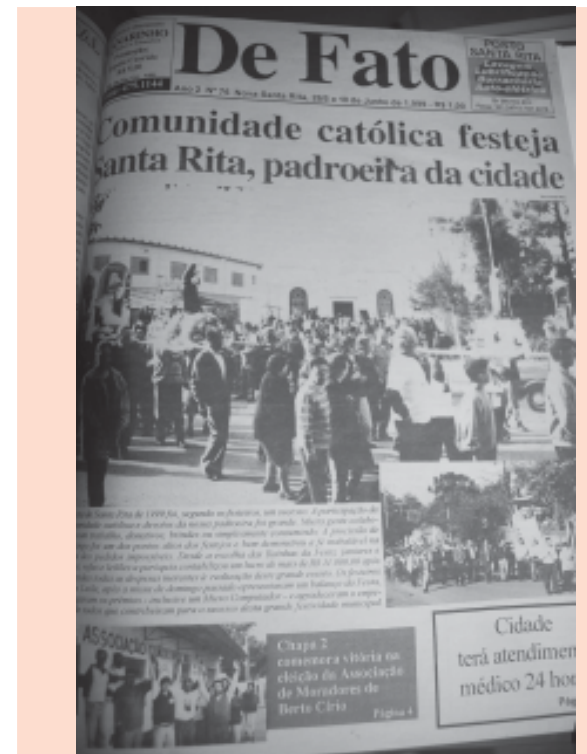
Ano 2 Nº 76, Nova Santa Rita, 28/5 a 10 de Junho de 1999

A festa de Santa Rita de 1999 foi, segundo os festeiros, um sucesso. A participação da comunidade católica e devotos da nossa padroeira foi grande. Muita gente colaborou com trabalho, donativos, brindes ou simplesmente consumindo. A procissão de domingo foi um dos pontos altos dos festejos e bem demonstrou a fé inabalável na santa dos pedidos impossíveis. Desde a escolha das Rainhas da festa, jantares e bailes, rifas e leilões a paróquia contabilizou um lucro de mais de R$ 11.000,00 após deduzidas todas as despesas inerentes à realização deste grande evento. Os festeiros Luiz e Leila, após a missa de domingo passado apresentaram um balanço da festa, entregaram os prêmios - inclusive um Micro computador - e agradeceram o empenho de todos que contribuíram para o sucesso desta grande festividade municipal.